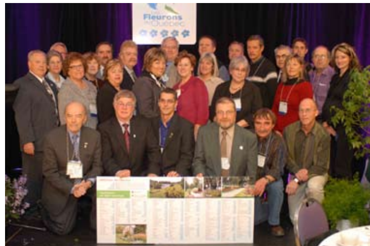
Les représentants des municipalités de la Mauricie et de Montérégie recevant leurs Fleurons du Québec: Saint-Étienne-des-Grès, Trois-Rivières, Mont-Saint-Hilaire, Saint-Clet, Saint-Cyprien-de-Napierville, Sainte-Anne-de-Sorel, Sainte-Marthe, Saint-Hyacinthe, Saint-Joseph-de-Sorel, Saint-Michel, Saint-Paul-de-l'Île-aux-Noix, Saint-Philippe, Saint-Urbain-Premier, Salaberry-de-Valleyfield, Sorel-Tracy, Vaudreuil-Dorion.