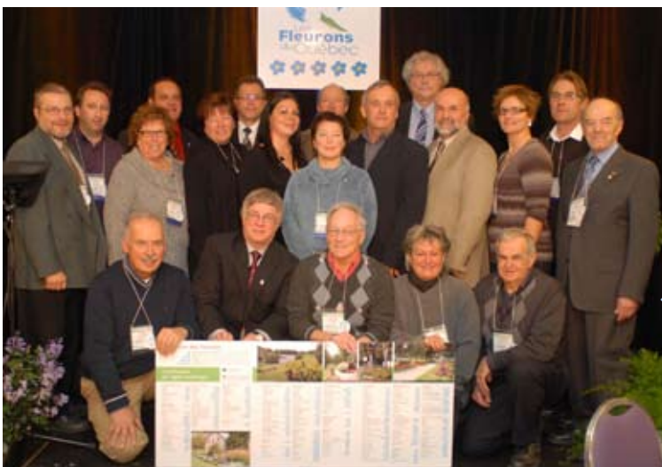
Les représentants des municipalités de Montréal, de l'Outaouais, de Québec et du Saguenay-Lac-Saint-Jean recevant leurs Fleurons du Québec: Arrondissement Sud-Ouest de la ville de Montréal, Pointe-Claire, Sainte-Anne-de-Bellevue, Westmount, Saint-Augustin-de-Desmaures, Maniwaki, Sainte-Famille, Sainte-Pétronille, Saint-Laurent-de-l'Île-d'Orléans, Alma, L'Anse-Saint-Jean et L'Ascension-de-Notre-Seigneur.