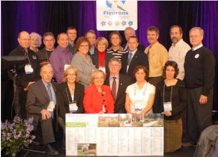
Les représentants des municipalités du Bas-Saint-Laurent, des Cantons-de-l'Est et du Centre-du-Québec recevant leurs Fleurons du Québec: Cabano, Lévis, Notre-Dame-du-Lac, Cowansville, Eastman, Granby, Lac-Mégantic, Inverness, Lyster, Saint-Célestin, Saint-Cyrille-de-Wendover, Victoriaville et Warwick.