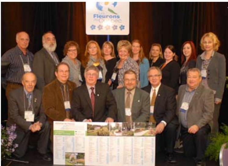
Les représentants des municipalités des Laurentides recevant leurs Fleurons du Québec: Blainville, Bois-des-Filion, Deux-Montagnes, Lachute, Mont-Laurier, Rosemère, Sainte-Agathe-des-Monts, Sainte-Thérèse et Saint-Jérôme.