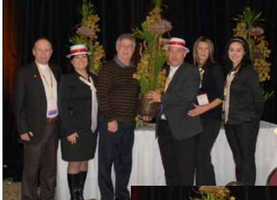
Le Flores Or est remis à la Coopérative horticole Groupex.

La FIHOQ tient à féliciter tous les récipiendaires!