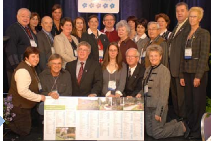
Les représentants des municipalités de Chaudière-Appalaches, de Duplessis, de la Gaspésie et de Lanaudière recevant leurs Fleurons du Québec: Lac-Étchemin, Sainte-Marie, Saint-Jean-Port-Joli, Saint-Magloire, Sept-Îles, Amqui, Mont-Joli, Chertsey, Joliette, Repentigny, Saint-Esprit et Saint-Roch-de-l'Achigan.