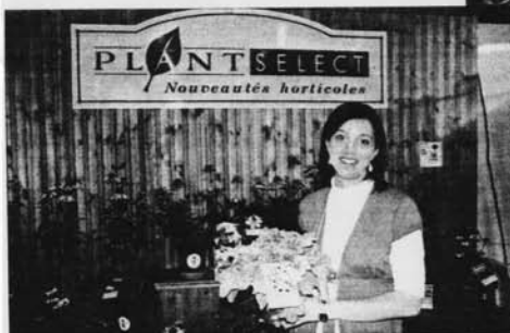
Le grossiste PlantSelect se démarque par sa mise en marché soignée. Des ententes exclusives avec des fournisseurs, de belles étiquettes et des plantes bien présentées et en santé font la marque de commerce de la jeune entreprise de Saint-Paul-d'Abbotsford.