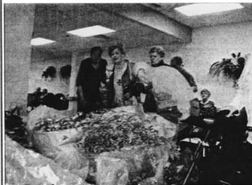
Les Résidences Richeloises à McMasterville sont parmi les 55 centres pour personnes âgées qui ont eu le plaisir de recevoir des végétaux offerts gracieusement par les organisateurs et les exposants de l'Expo-FIHOQ.