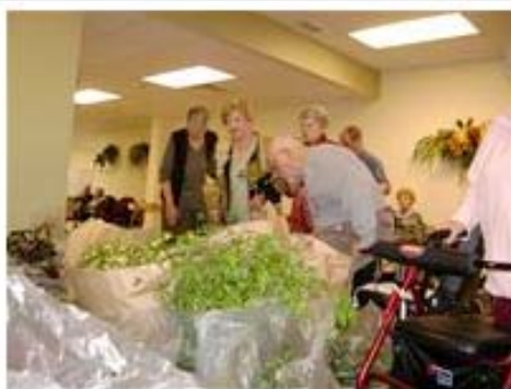
Près de 300 plantes ont été livrées aux Résidences Richeloises, à McMasterville, au grand plaisir des résidents.